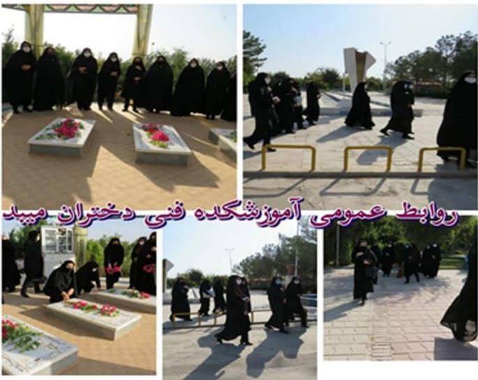
روابط عمومی آموزشگاه فنی دختران میبد