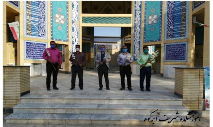
آموزشگاه شریف ابروه