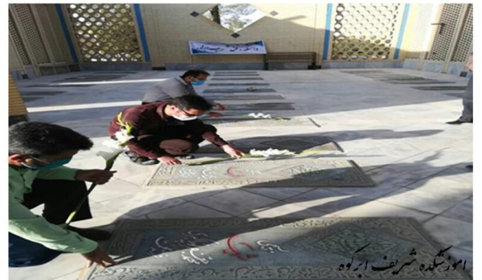
آموزشگاه شریف ابروه