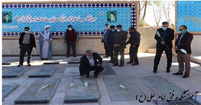
آموزشگاه فنی امام علی (ع)