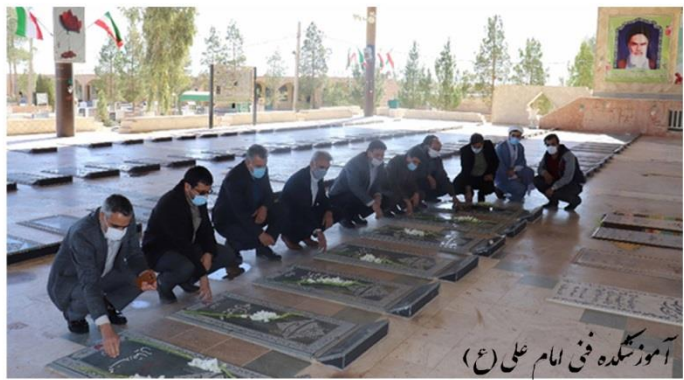
آموزشگاه فنی امام علی (ع)